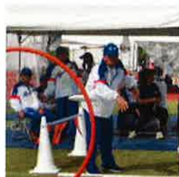
フライングディスク