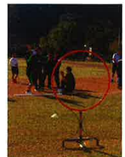
<フライングディスク>