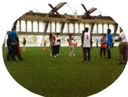
【グラウンドゴルフ】