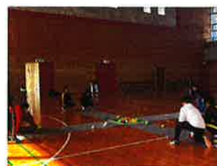
＜宮崎リハビリテーション学院＞