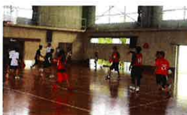
<バスケットボール>