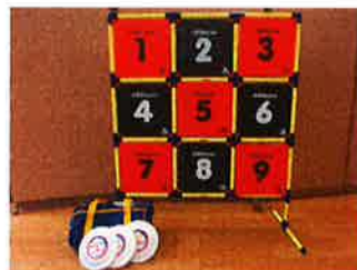
<ディスクゲッター>